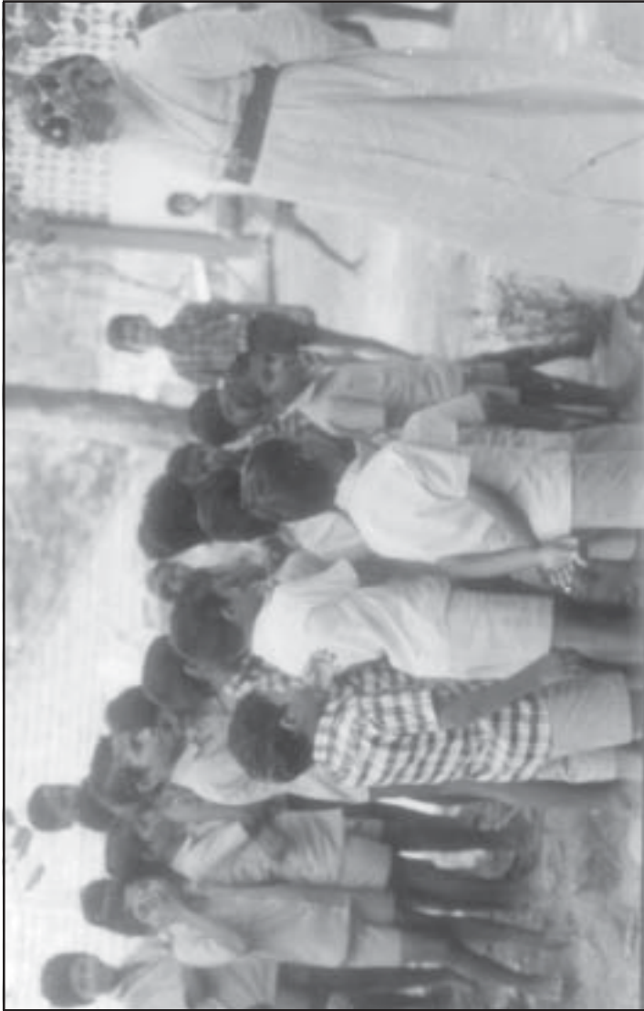
ഡോ. പൗലോസ് മാർ ഗ്രീഗോറിയോസ് തിരുമേനി തലക്കോട് സെന്റ് മേരീസ് ബോയ്സ് ഹോമിലെ കുട്ടികളോടൊപ്പം