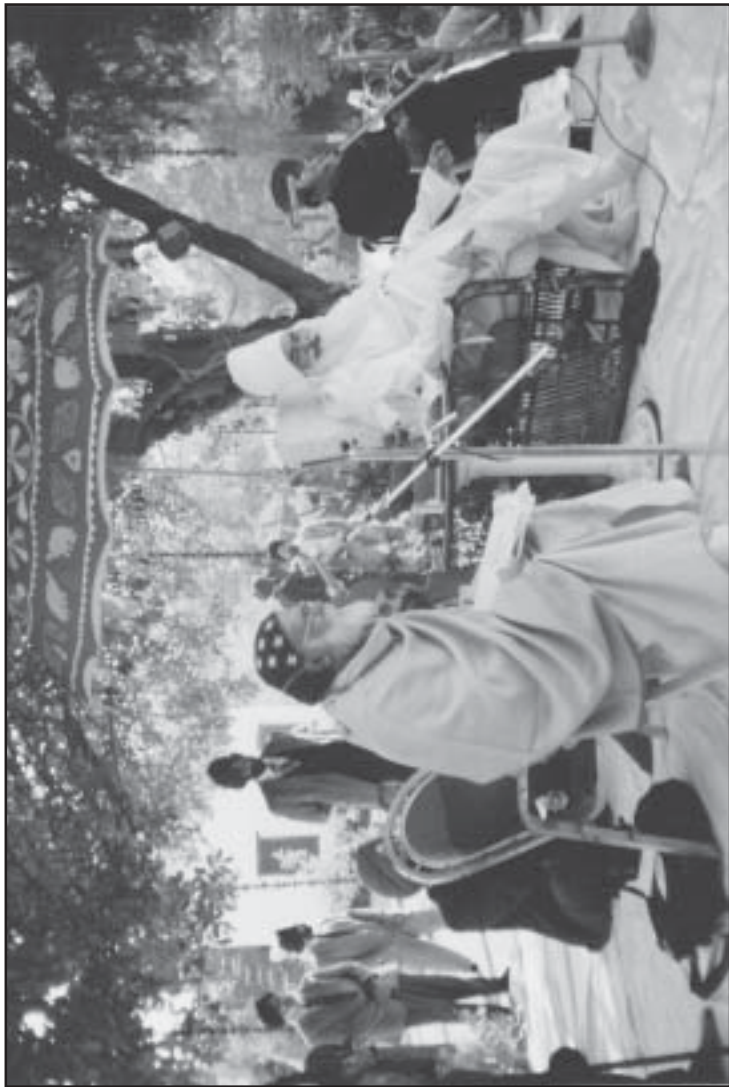
ഡോ. പൗലോസ് മാർ ഗ്രീഗോറിയോസ് തിരുമേനി ജൂഷികേശിൽ 1993 ഡിസംബർ 5-12 തീയതികളിൽ നടന്ന സർവ്വമത സമ്മേളനത്തിൽ സംസാരിക്കുന്നു.