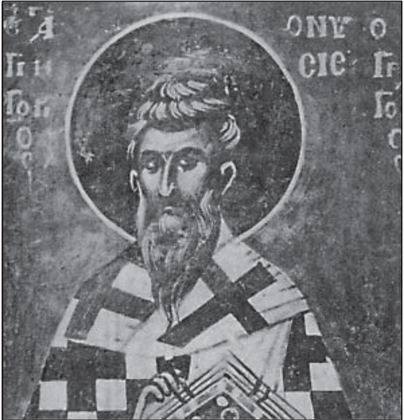
നിസ്സായിലെ വി. ഗ്രീഗോറിയോസ്